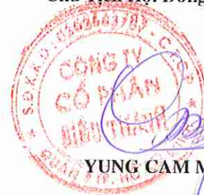
YUNG CAM MENG